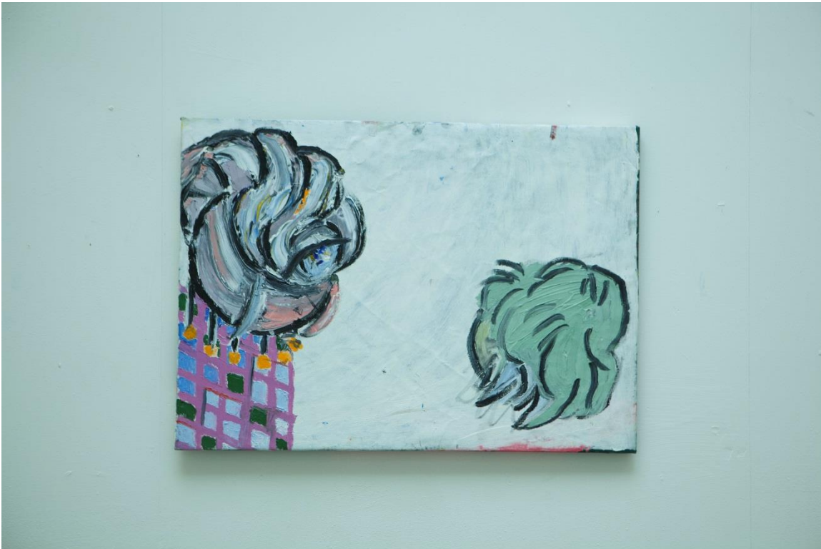
Utan titel, 2015

Jag har jobbat aktivt för att sluta skämmas för vad jag tycker är fint. Vad som är konst för mig. Jag lärde mig det i Finland.