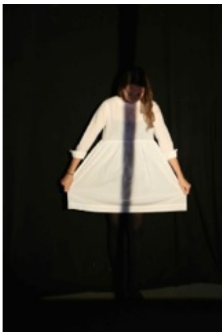
Bild 3 tyget. Ränderna ser skarpare ut mot huden och bakgrunden, men på tyget blir de mer flytande och otydliga. Mot bakgrunden är ränderna raka och strikta medan de följer gestaltens och tygets former och formar sig efter varje lilla veck.

Vi byter till en enkel overhead-projektion på kroppen (se bild 4) av en enkel rand, eller en linje. Uttrycket förändras drastiskt från den rödvita projektionen till dystert och mörkt. En svart bakgrund, vit klänning och en enkel rand faller över kroppen och den mörka duken som knappt syns. Man får känslan av att vi befinner oss i en svartvit film. Randen markerar, den bildar en skugga på klänningen och ljuset från projektionen lyser upp den. Golvet definieras av en tunn ljus strimma på golvet.