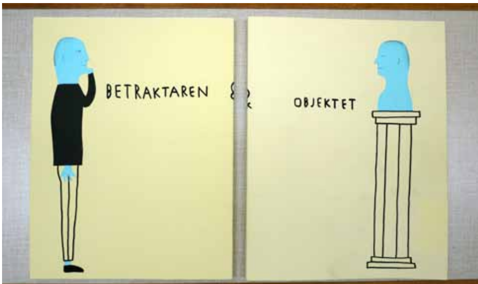
Boken fram och bak