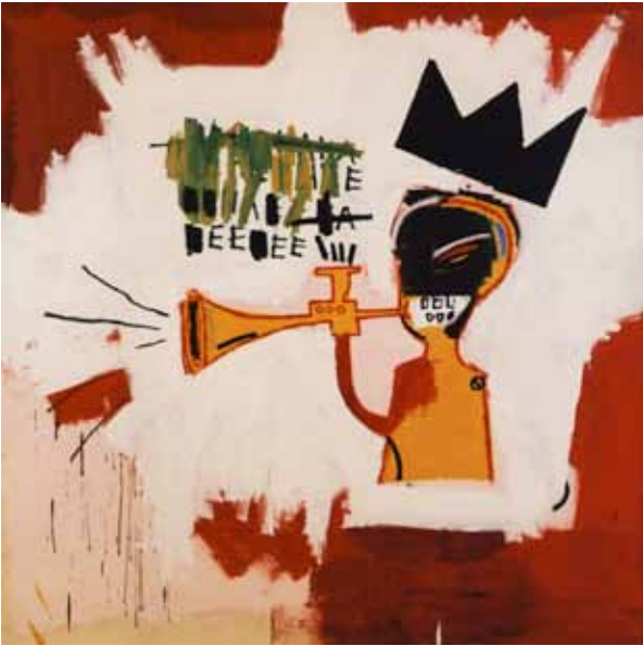
Jean Michel Basquiat, trumpet 1984