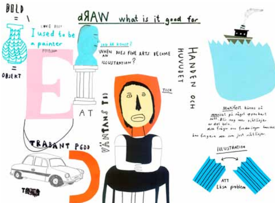
Skiss till uppslag