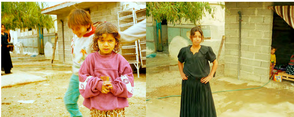
Fotograf Angelica Harms 1994