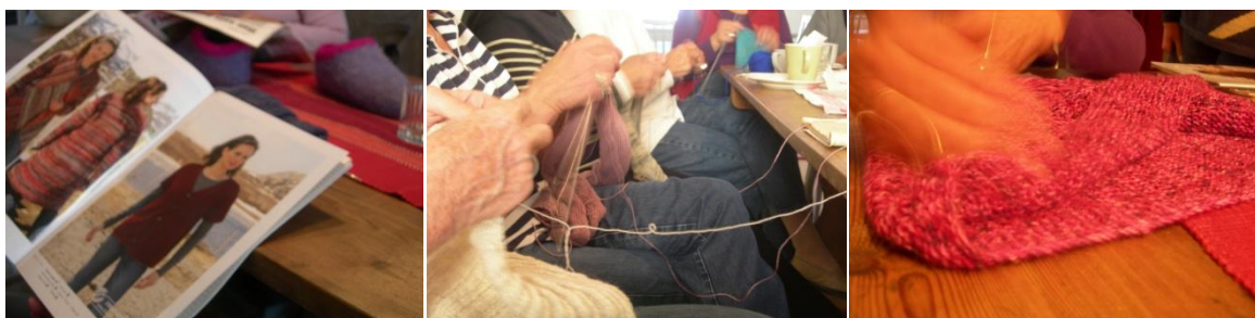
Plats 2: Stickcafé