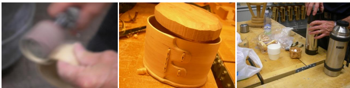
Plats 1: Undersökningens första besök; hos en slöjdgrupp som arbetade i trä.