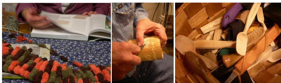
Plats 3: Tälj- och stickcafé