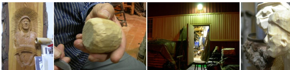
Plats 6: Träjunta