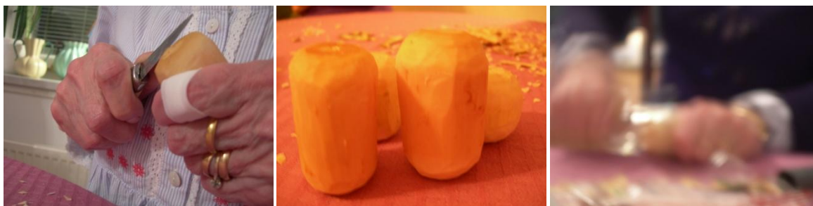
Plats 5: Träworkshop med syjunta