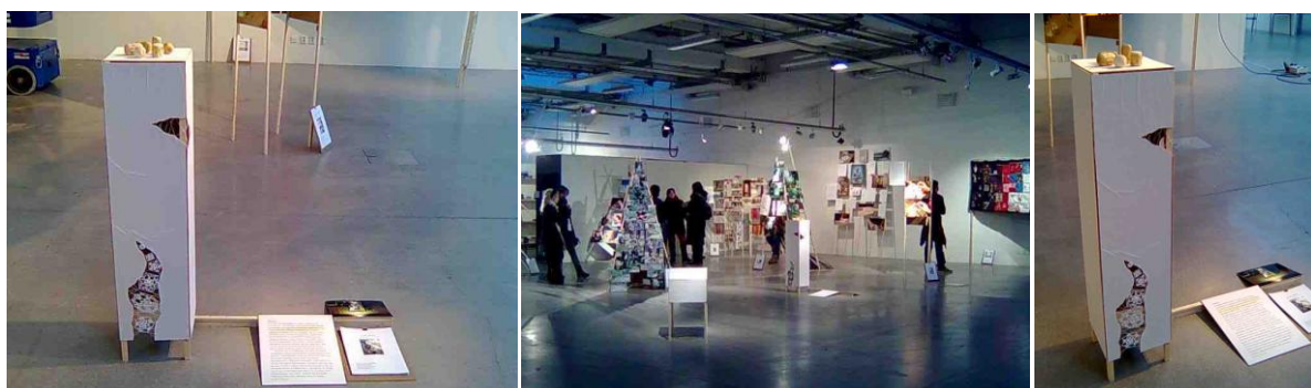
Plats 7: Utställning på Konstfack

Den konstnärliga gestaltningen av undersökningen utgick från tankar kring skillnaden mellan att arbeta i två tekniker som att tälja och virka, där man antingen tar bort material eller lägger till material. Det var också tänkt att den med sin podieform skulle upphöja de små runda träformer som var resultatet av träworkshopen med syjunta. Fotografiet som ingick i gestaltningen är taget utanför plats 6 där träjunta till slut påträffades.