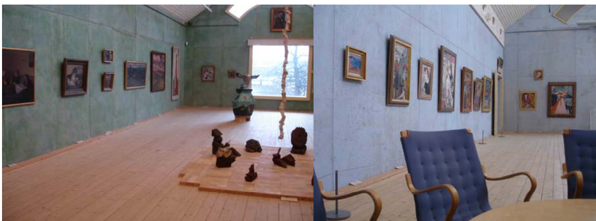
Bilderna visar delar av museets utställningsrum för samlingarna av 1900-tals och 1800-tals konst. Verken hänger i ögonhöjd, passande för vuxna besökare. Somliga verk har även placerats på högre nivå.

Konsten från museets samlingar visas i tre av museets utställningssalar, där utställningarna hängs om emellanåt. Omfattningen av omhägningarna är beroende av vilka resurser som finns på museet, och vilka prioriteringar som görs. Då utställningarna hängs om är en av filosofierna att bryta invanda mönster hos besökarna, och få dem att uppleva och intressera sig för konsten i samlingen med nya ögon. Detta görs genom att laborera med verkens placering gentemot varandra i utställningsrummet, samt genom konstverkens urval. 84