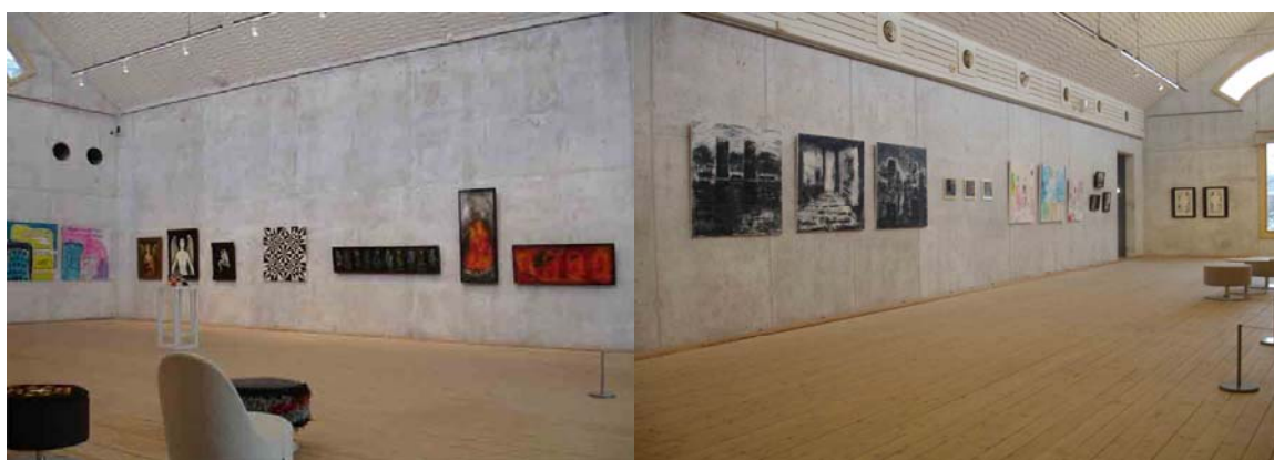
Bilderna visar delar av museets två salar för tillfälliga utställningar. Utställningen Länssalongen pågår i båda salarna. Verken hänger mestadels i rader, där ögonhöjden är anpassad för en vuxen åskådare.