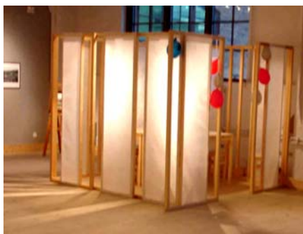
Stockholms läns museum har en verkstad, som används i museilokalerna.

För att möjliggöra verkstadsaktiviteter i museibygnaden, har konstpedagogen möjlighet att ställa in en mobil verkstad i utställningslokalen. Aktiviteterna i verkstaden brukar vara förbundna med den utställning som visas. Då man visade utställningen Djur i Centrum , tillverkades djur i lera i verkstaden. 55 Samtliga konstpedagogiska visningar, workshops och verkstadsaktiviteter som finns på museet, och i länet utförs av museets konstpedagog.