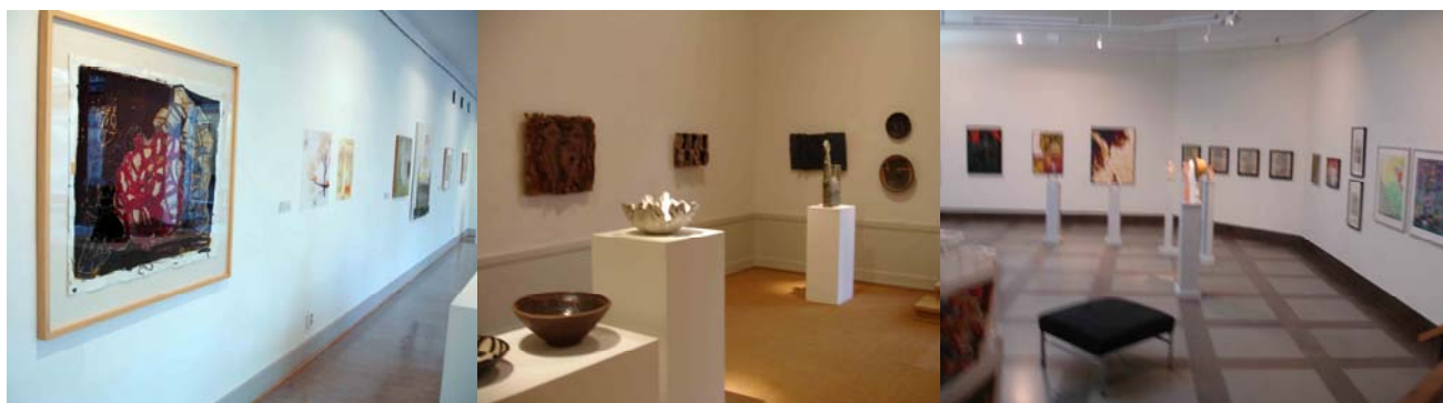
Bilderna visar hur konsten exponeras i tre av Örebro läns museums utställningssalar. På väggen hänger konstverken i en linje, centrerade i höjdlid. Centrum för höjden är passande för en fullvuxen person.

för höjden är passande för en fullvuxen person. Skulpturala objekt visas på podier i olika höjd. Många podier är runt en meter höga. 73