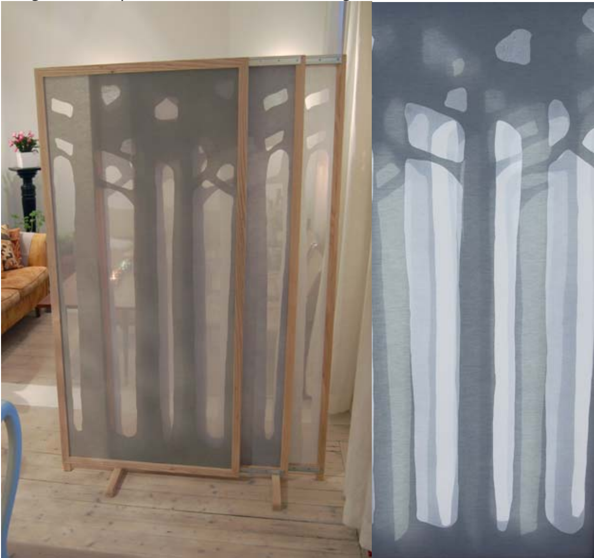
Skärm och mönster