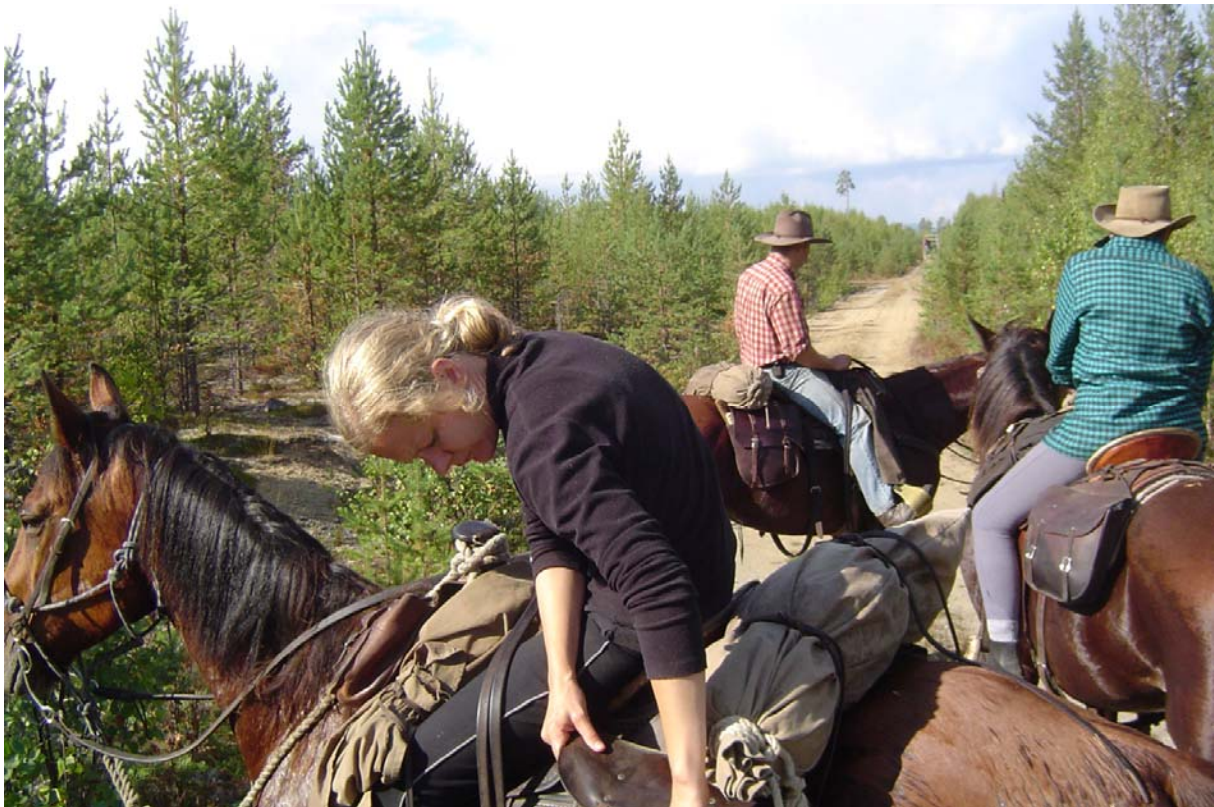
Bilder från resan som visar känslan av skogen, hästarna och förvaringen