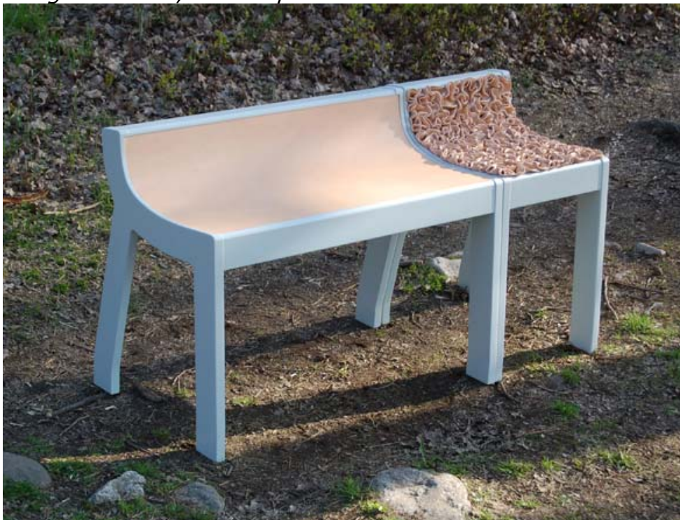
Bänk och stol Avanti