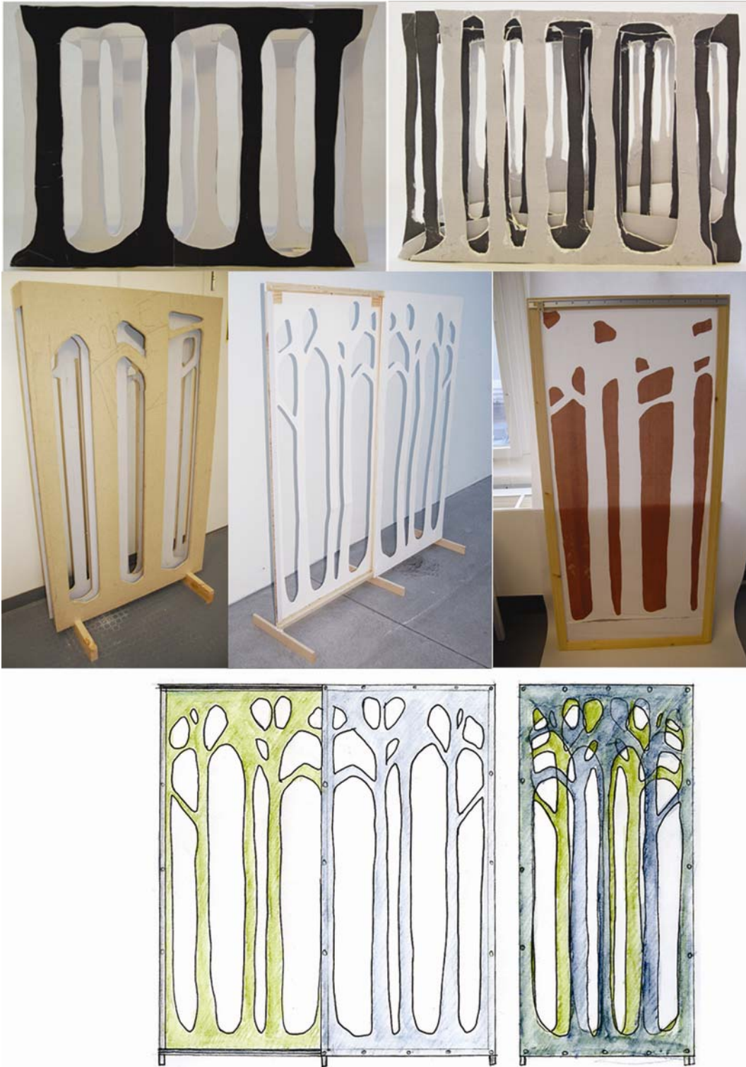
Skiss och modellarbete med skärmen Fura