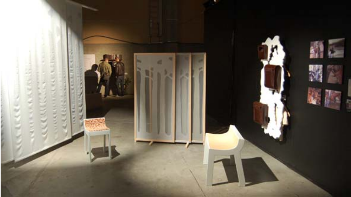
Skogsrummet på Konstfacks vårutställning