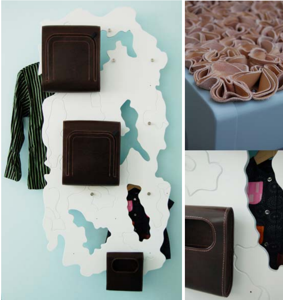
Hängare Avanti, närbild på väskor samt stolens sits.