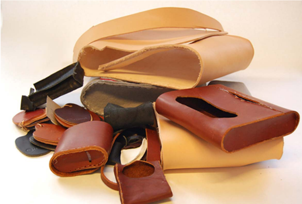
Prototyp tillverkning av väskor