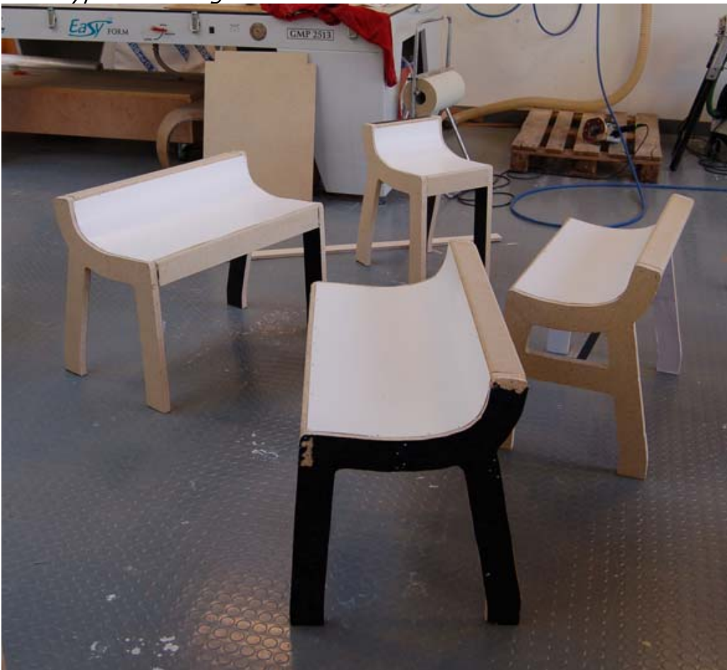
Mokuper av bänk och stol för att finna form och sittkurva.