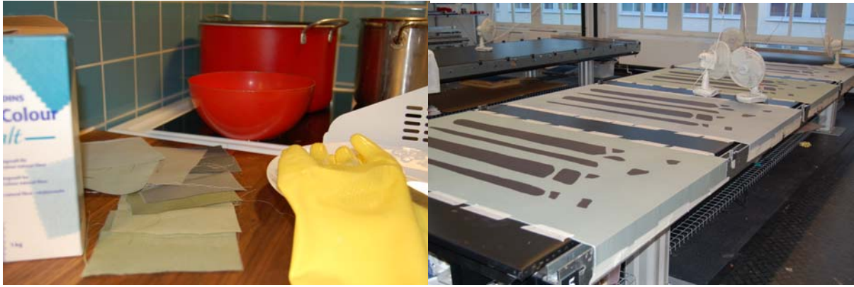
Färgning och bränning av tyger