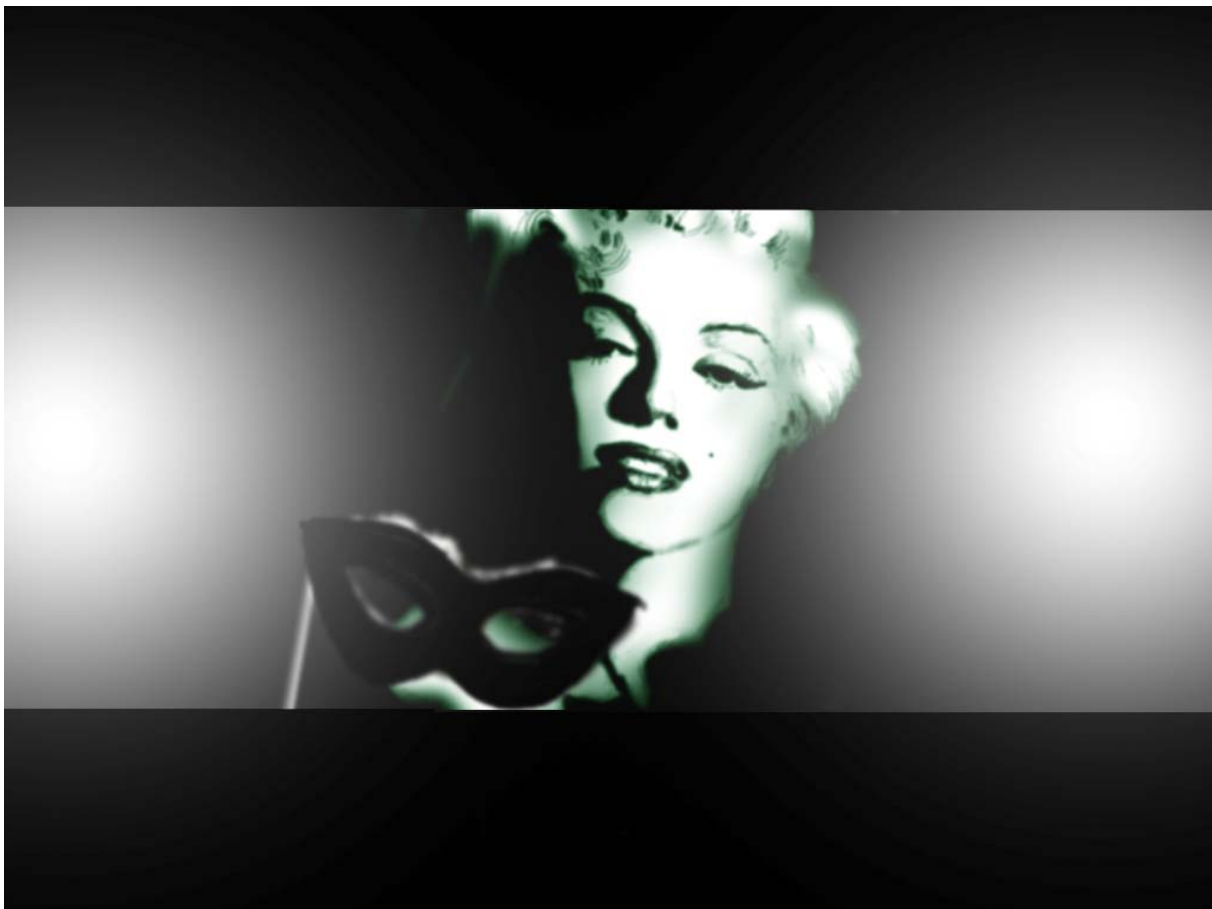
"Den kvinnliga maskeraden" ur filmen The Heterosexual Matrix

hur S-tjejerna ses som norm medan BF-tjejerna utpekade som avvikande både bland skolpersonalen och bland elever. Den avvikande gruppen har i den här studien, liksom i Fundbergs studie, lägre status än den grupp som ses som norm. De avvikande grupperna utsattes för av olika former av marginalisering eller stigmatisering. Men det var inte BF-tjejernas framtid och yrke som gav dem den negativa stämpeln av omgivningen. Den fick de istället utifrån deras avvikande beteende enligt föreställningar om hur man bör bete sig och se ut som tjej.