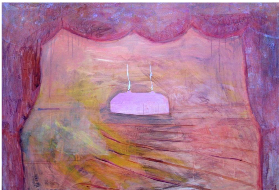
Modersmjölk, Marika Holm 2010, 88x130 cm, akryl på duk