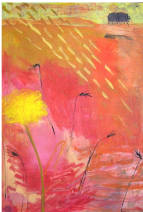
Maskrossaft, Marika Holm 2010, 88x 130cm, akryl på duk