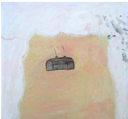
Sot och spets 2010, Marika Holm 45x48cm, akryl på duk