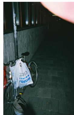
Bilder. Cykel med påsar och Kåsa på skötbord. Anonym fotograf.