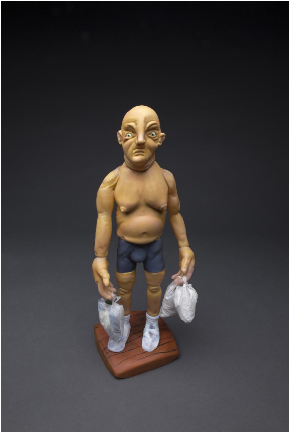
19.43 (Garbage man). 38x16x16 cm