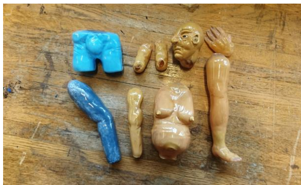
Processbild , delar innan montering.

Med en uppsättning delar kan jag sedan para ihop dem som passar ihop och kan ge den känsla och stämning som jag eftersträvar, varpå jag senare värmer upp dem igen och sätter ihop dem i glasverkstaden till hel figur/skulptur. För att vara säker på att verkligen utjämna eventuella spänningar kyls glaset i minst 24 timmar ner till rumstemperatur, varpå jag föredrar att låta det vila i 24 timmar innan jag slipar glaset för att retuschera eventuella detaljer. Efter det sandblästras skulpturerna och smörjs med olja för att få en satinliknande finish. Genom att ta bort glasets glansiga yta framhäver jag också mindre volymskillnader.