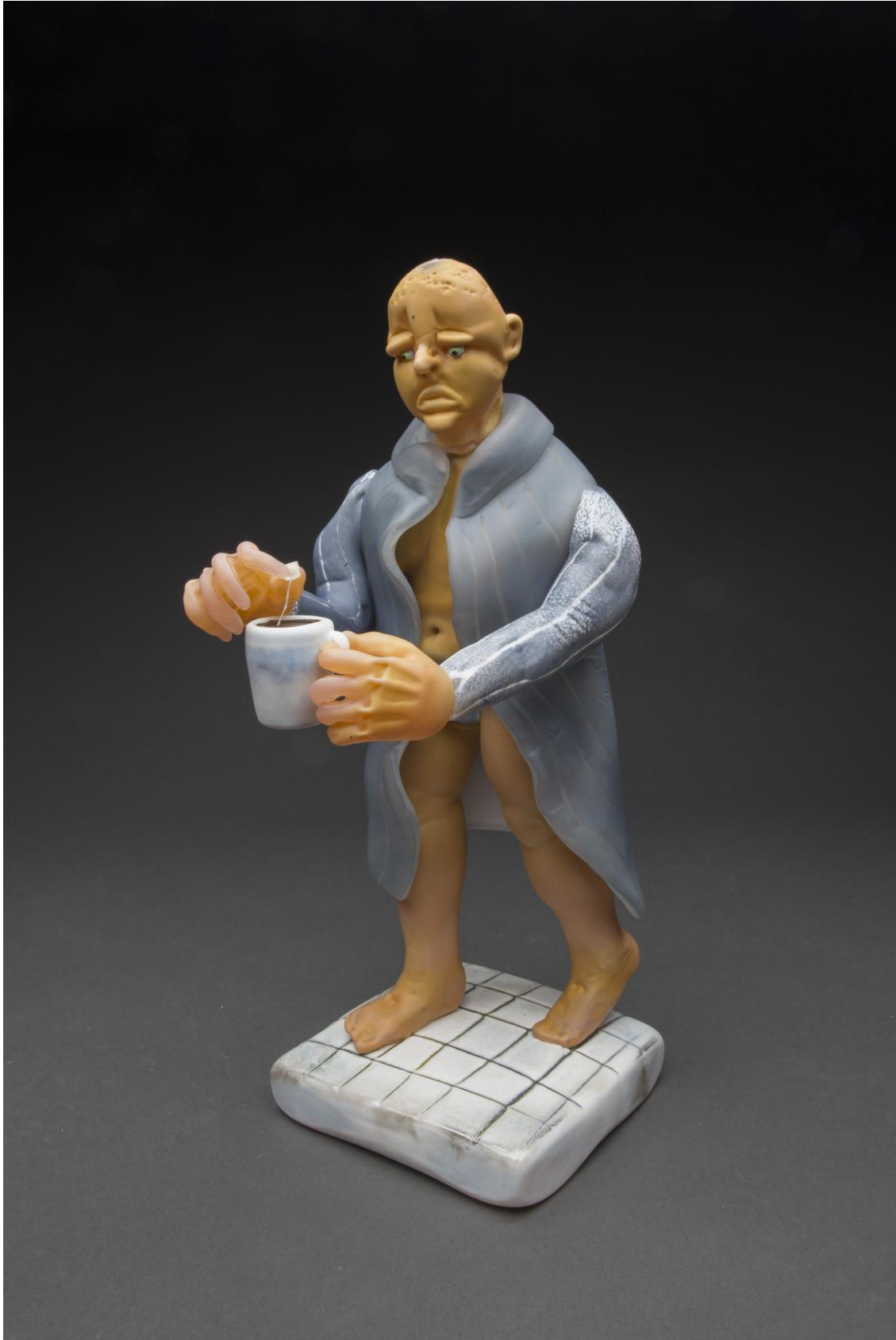
07.30 (Lemon Tea). 36x20x20 cm Foto: Rasmus Nossbring.