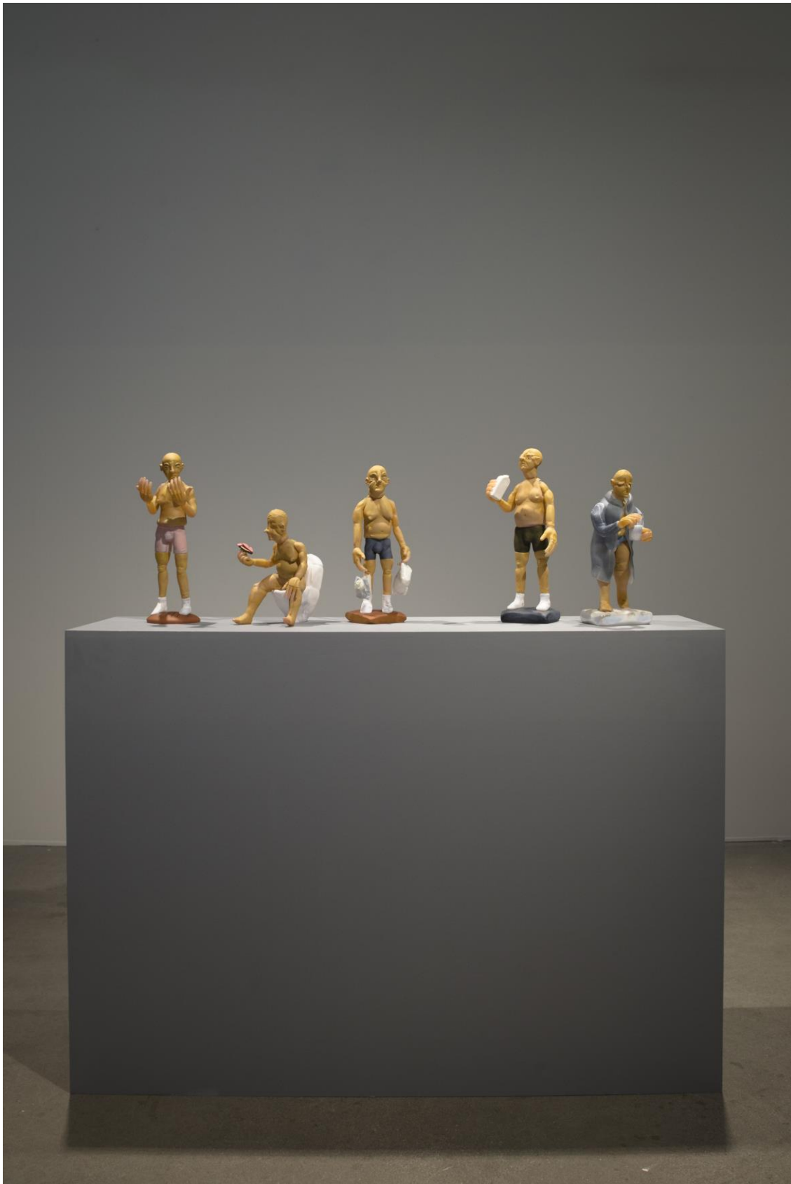
De som väntar, från examination.