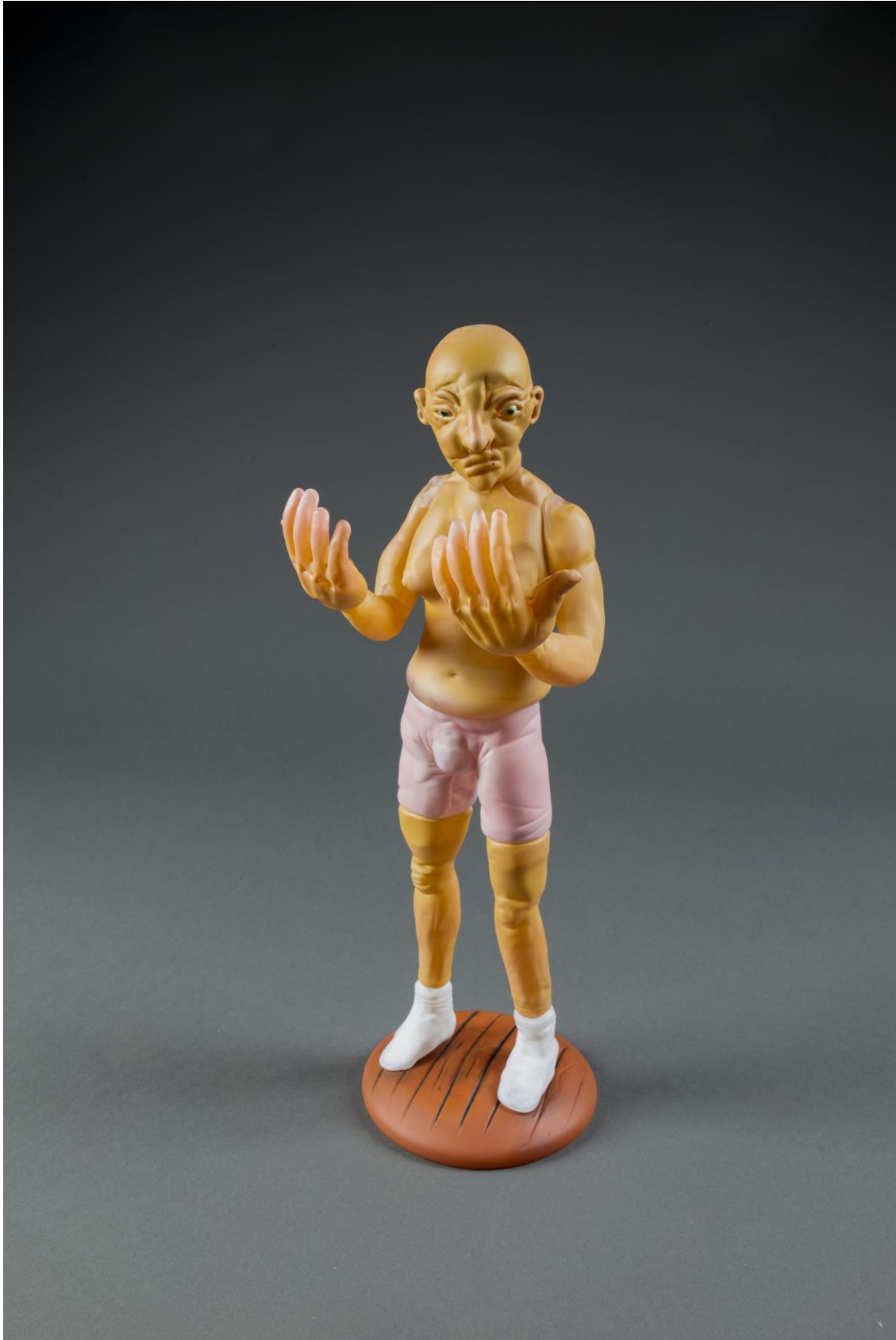
16.09 (Most Calusses Wins). 42x21x21 cm