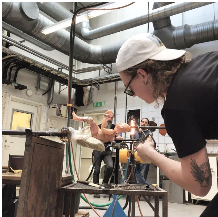
Processbild, montering av skulptur.

Vid min utbildning till glasblåsare var rutin högst närvarande för kontinuitet och förståelse för hur saker skulle göras. Först moment ett, snabbt följt av moment två, tre och fyra, sen skicka vidare till nästa person som utför resterande moment. För att lära mig materialet var jag tvungen att förstå glasets behov och tempo, något som sällan går att kompromissa. Var sak har sin tid. Glöms kylning av botten bort innan en blåser i pipan blir botten för tunn, är den däremot för kall blir den för tjock. Produktionen skulle flyta som en väloljad maskin. När dessa rutiner till slut satt sig i ryggmärgen var de svåra att alternera, något jag märkte när jag började skulptera glaset där processen är mer flytande och intuitiv. I och med att jag förstår glaset bättre kan jag forma det mer rutinmässigt och det kräver mindre psykisk