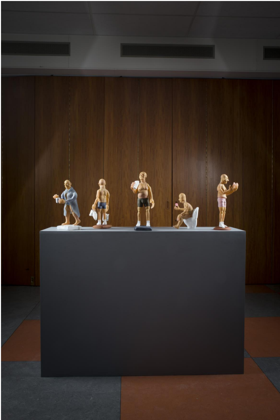
De som väntar, från vårutställning.